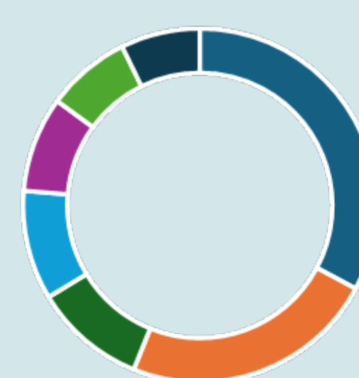
Besök via direktlänk

Den vanligaste vägen till Harvardguiden går via sökmotorer så som Google som sammanlagt genererat 236 528 besök.