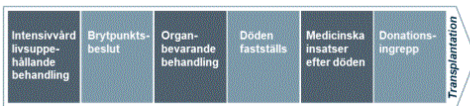
Figur 1: Donationsprocessen (Socialstyrelsen 2022b).

Det kan skilja sig hur donationsprocessen handläggs internationellt, beroende på lagstiftning och andra rutiner. Nedan följer en kortfattad beskrivning för hur processen går till i Sverige (Figur 1).