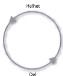
Figur 1: Den hermeneutiska cirkeln, ursprunglig version. 90

Inom hermeneutiken studerar forskaren tolkning av texter. Syftet med den hermeneutiken tolkningen är att få en giltig och gemensam förståelse av meningen i texten. 84 Det hermeneutiska perspektivets centrala tema är tolkning av mening, med specifikt fokus på de speciella slag av meningar som eftersöks, och de frågor som forskaren ställer till texten. 85 Samtalet och texten är central i den hermeneutiska traditionen, och vikten läggs på uttolkarens förkunskap om textens innehåll. 86 Då vi vill förstå våra respondenter och det de berättar kommer vi att utgå ifrån en hermeneutisk meningstolkning. För att kunna förstå individens berättelser är det viktigt att se till kontexten och ej plocka ut det som sägs ur sitt sammanhang. Helhetsbilden skapar på så vis förståelsen för respondentens svar och berättelse. Det är av stor vikt att hålla sig inom ramarna och att forskaren ej går utanför temat. 87 Ett huvudtema för hermeneutiken är att "Meningen hos en del endast kan förstås om den sätts i samband med helheten" 88 Tolkningsprocessen sker med hjälp av den hermeneutiska cirkeln där delarna och helheten ständigt samverkar. 89