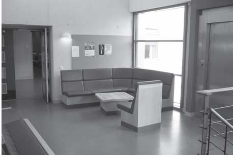
Figur 18. Soffa på plan 2 i södra delen av biblioteket (foto: förf., 2008-04-14; se även fotnot 94 i avsn. 7.5.3.1 ovan).