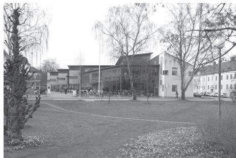
Figur 12. Biblioteket med öppen gård och huvudentré mot nordost. Norr om biblioteket park med stigar, och i väster (till höger) äldre radstående hus.