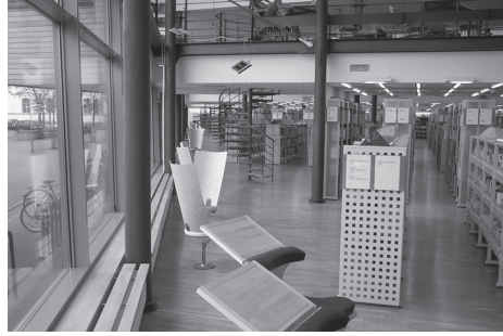
Figur 19. Roterbara stolar på huvudplanet vid den långa glasväggen mot gården.