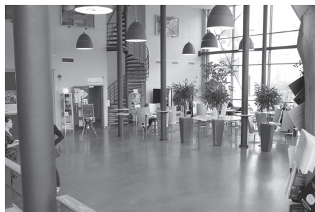
Figur 17. Café i biblioteket.