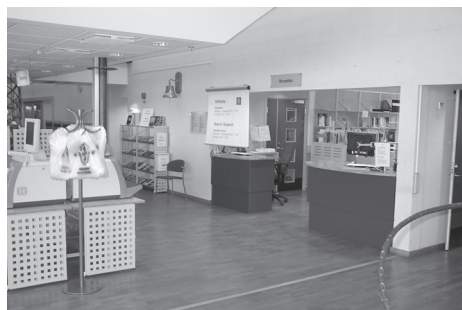
Figur 16. Informationsdisk.